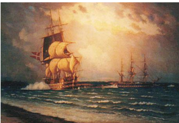
Christian VIII. og Gefion (maleri fra Kiel museum)