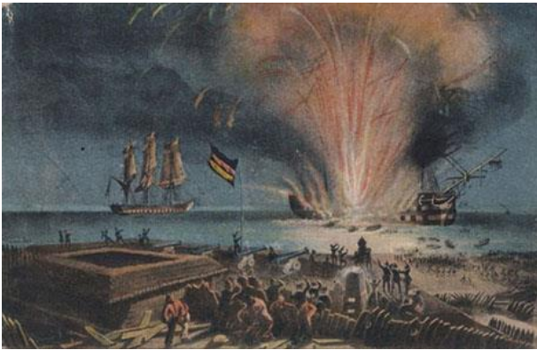
Christian VIII. sprænger i luften. Fra et Schlesvig-holstensk postkort