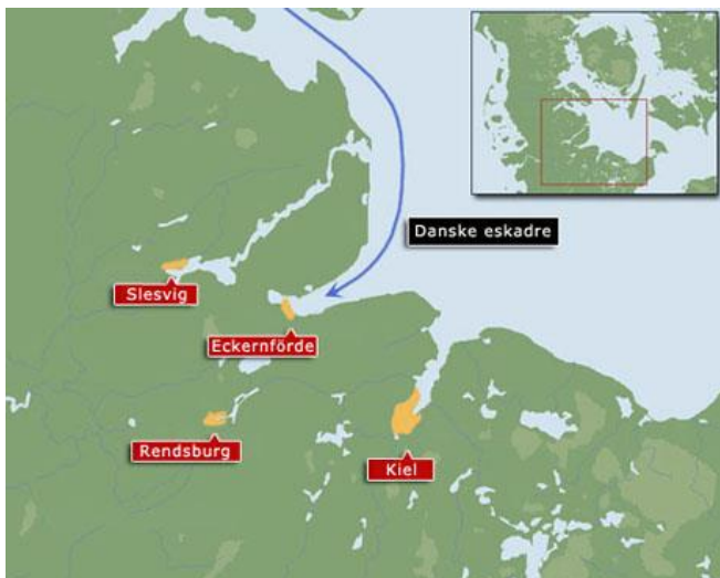
Kort over området omkring Eckernförde